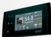
Dotykowy regulator kotłowy ESTYMA TOUCH w standardzie