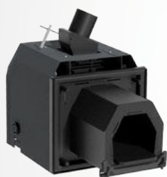
Palnik serii FIREBLAST z automatycznym czyszczeniem